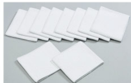
ゆースタークロスシリーズ 専用ベルト