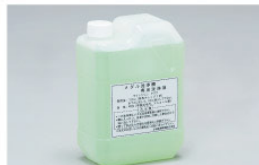
ゆースター専用洗浄液 (ライトクリン 777)